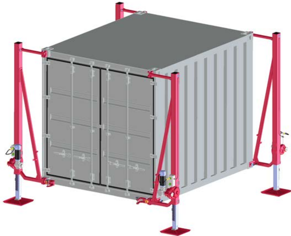
Abb. zeigt stirnseitig beischwenkbare Ausführung mit automatischer Nivellierung 24 V-DC / fig. shows version swivelling along short side with automatic levelling 24 V DC / fig. version pivotante frontale avec mise à niveau automatique, motorisation 4 x 24 V DC

Dispositif de levage 20 t pivotant, type 1889.20