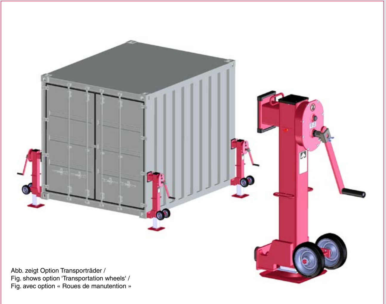
Abb. zeigt Option Transporträder / Fig. shows option 'Transportation wheels' / Fig. avec option « Roues de manutention »