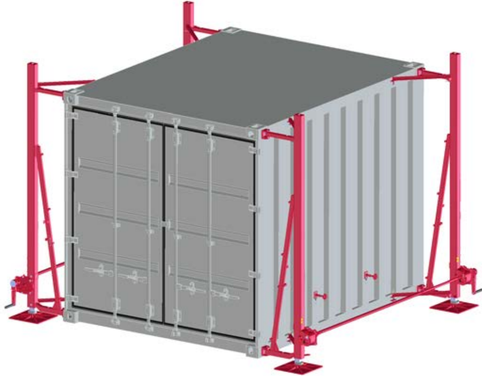
Abb. zeigt längsseits beischwenkbare Ausführung mit manuellem Antrieb / fig. shows swivelling version long side, manually operated / fig. version pivotant longitudinal, opération manuelle

Dispositif de levage 5 t pivotant, type 1889.5