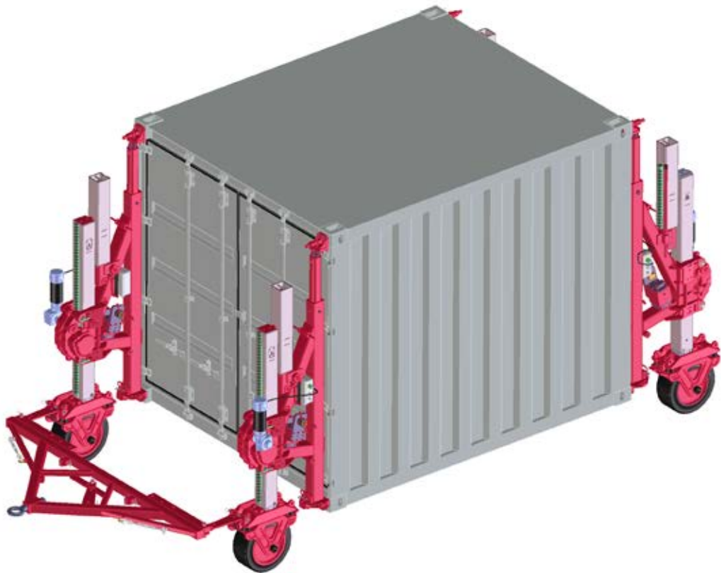
Abb. zeigt Ausführung mit motorischem Antrieb 24 V-DC / fig. shows version with motor drive 24 V-DC / fig. avec version motorisée 24 V-DC

Moyen Techniques de Manutention mobile 10 t (MTM), type 1350.FR